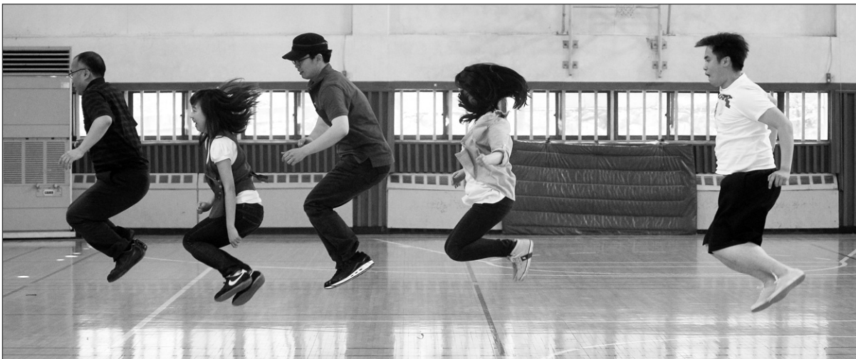
체육대회 줄넘기 경기에서 공병설 노조 위원장이 이끈 D조가 20차례 이상 뛰어올라 우승했다.